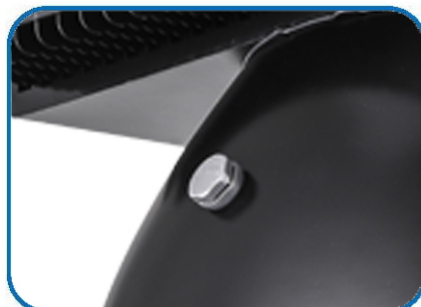
呼吸装置便于热空气排出散热