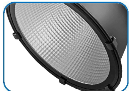
高反射率多面体反射罩